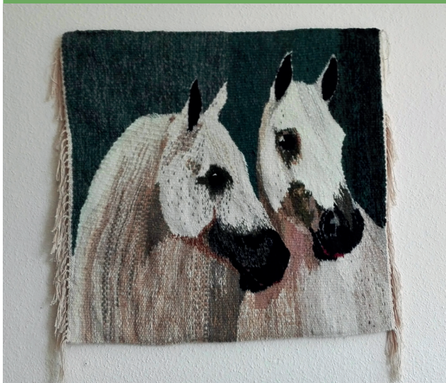
Wystawa gobelinów (11.04. - 12.05.) Salon Wystaw PGNiG SA