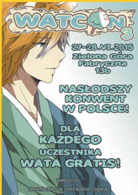
Zielonogórski Klub Fantastyki Ad Astra