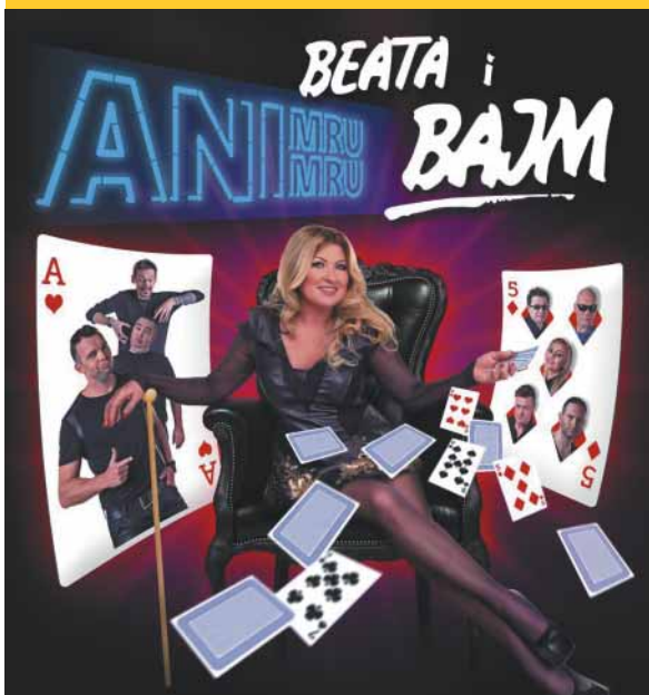
Hala widowiskowo-sportowa CRS (20.06.)