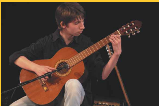
XIII Spotkania Młodych Instrumentalistów Zielonogórski Ośrodek Kultury (11.06.)