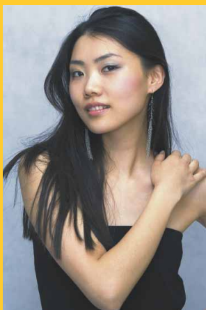
Klasycznie i romantycznie – koncert symfoniczny Filharmonia Zielonogórska (12.06.)