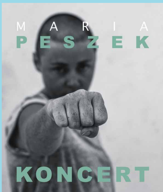
Piwnica Artystyczna KAWON (24.10)