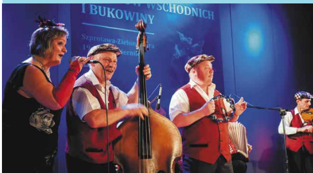
VII Prezentacje Kultury Polaków z Kresów Wschodnich i Bukowiny Regionalne Centrum Kultury (24.10)