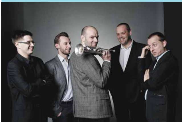
Koncert zespołu New Bone Zielonogórski Ośrodek Kultury (25.10)