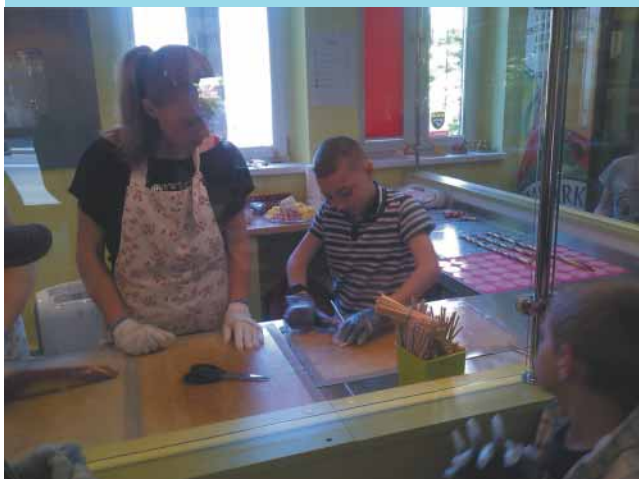
Warsztaty cukiernicze w Krainie Słodkości (4, 11, 18, 25.10)