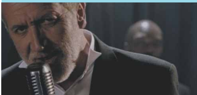
Koncert Gordona Haskell Filharmonia Zielonogórska (9.10)